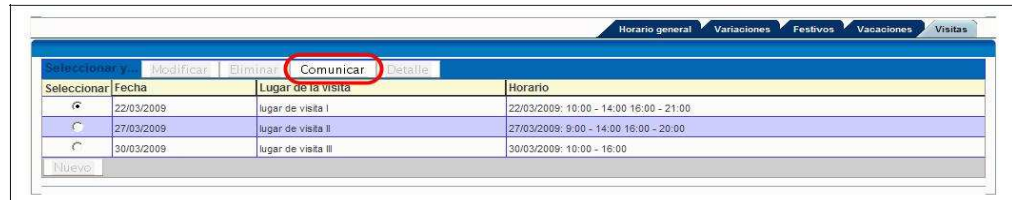
Imagen 14-Comunicar visita

Si al introducir el horario se han indicado visitas tiene el deber de notificar al SEF con la suficiente antelación la realización de las mismas. El lugar desde el que se hace esto es la pestaña “visitas” dentro de la ventana de resumen del horario (hcent10p, para más información sobre esta ventana mire el capítulo “introducir el horario”).