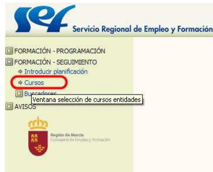
Imagen 1-Menú de selección de Curso

Busque y seleccione el curso sobre el que va a introducir el horario.